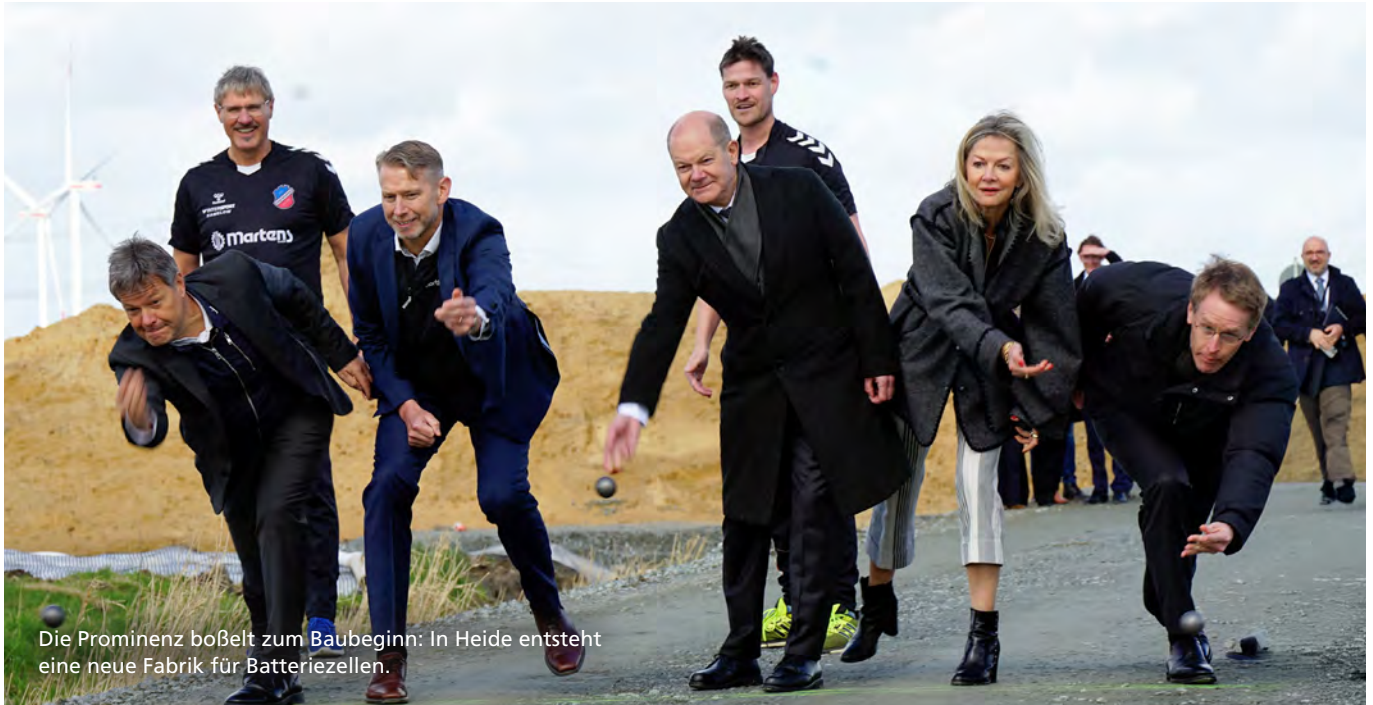
Die Prominenz boßelt zum Baubeginn: In Heide entsteht eine neue Fabrik für Batteriezellen.