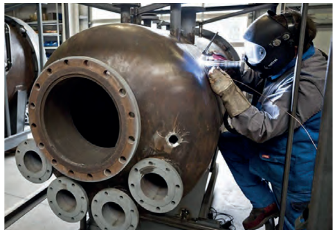
Dampfautoklaven von MK Technology: Sie sind für den Einsatz von Hochdruck- und Hochtemperaturdampf zur Abtötung von Mikroorganismen ausgelegt.

Hinzu kommen an vielen Orten des Landes Partnerschaften und Technologietransfers zwischen Hochschulen und Unternehmen. Dass allein in der niedersächsischen Stadt Göttingen 39 Messtechnik-Unternehmen ihren Sitz haben, hat viel damit zu tun, dass die mathematische Fakultät der dortigen Universität lange Zeit als weltweit führend galt: Auch wenn ihr Ruf in jüngster Zeit etwas gelitten hat, rangierte die Universität Göttingen im jährli-