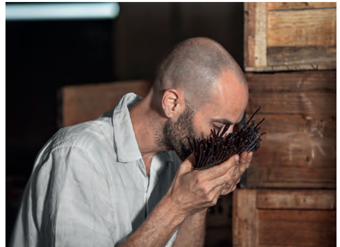
Tief einatmen: Um die Qualität der Vanilleschoten zu prüfen, ist ein Symrise-Mitarbeiter vor Ort in Madagaskar.

Abseits der ersten Reihe findet er immer wieder unentdeckte Titel mit großem Potenzial. „Weil sie von aktuellen Trends an der Börse genauso profitieren wie die Großen der jeweiligen Branche“, sagt er. Ein Beispiel: Gubra. Das dänische Unternehmen hat ein Präparat entwickelt, das die Wirkung der Schlankheitsspritze Wegovy von Novo Nordisk verstärkt. Das Marktpotenzial für Therapien gegen Übergewicht und Fettleibigkeit wird von Experten als hoch eingeschätzt. Beide Krankheitsbilder haben in den vergangenen Jahren vor allem in den Industrieländern stark zugenommen. Nach Angaben der Weltgesundheitsorganisation (WHO) ist mehr als die Hälfte der Erwachsenen in Europa zu dick und hat dadurch ein erhöhtes Risiko, an Herzinfarkt, Diabetes oder Krebs zu erkranken.